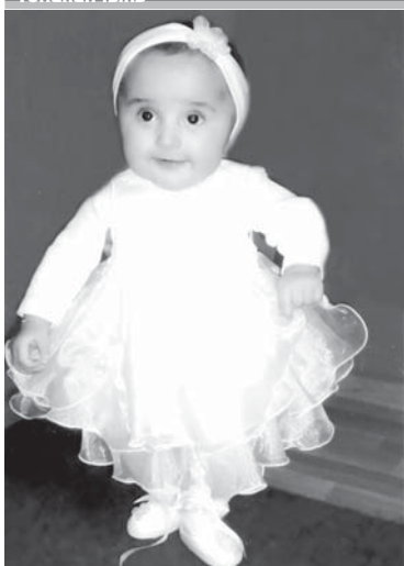
Цакланы Малика. Анга алты ай болады, Ташлы-Талада жашайды.