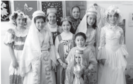
Сабийле кколсери тиккен жыйрымкылада.

Алага кыарай, озган өмюрлөгө кептик кыласа. Гинжитке уа окча бөркөлү бла таулу кызыны жыйрымкыга кийдиригенди. Дунитга махтаган «Барби» аны кытында иги да алашад кыалкычы.