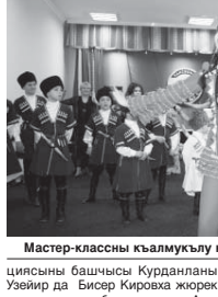
Мастер-классны кызуу кызыл көрүлдү.

Мастер-классны кызуу кызыл көрүлдү. Элбрус посылканы администрациясы башчысы Курданланы Узевир да Бисер Киорова жерги кызыл көрүлдү.