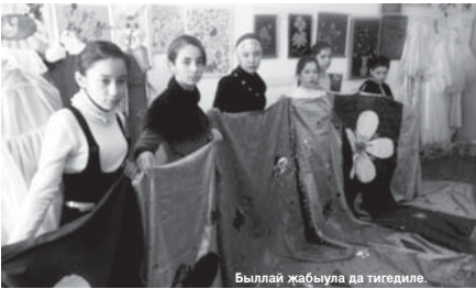
Быллай жабжула да тигедиле.