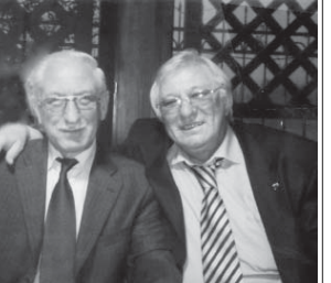
Шыарсагыз, алай насып сындам.

Бу коюнде аланы келле алгышылганыларына сөз да жокуду. Биз да, ол алгышылгаса кышуулугу, кыыйын, тынн көндө деп мыссылан, дароо жаны да коюгондон отмай, саутулугузу бля, кыаруугуз у бля кеп жылланы жашагыз, дөйбиз. Тууган эгелери, бизни белгиле эдме сойгон намуучу Таниляны эгиз кыяриндашларына атап жазган намууланы башалайбыз.