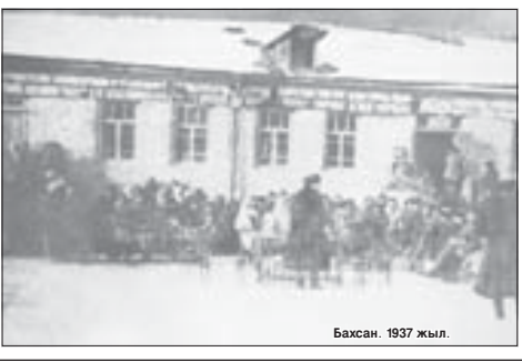
Бахсан. 1937 жыл.

Алай бла 1561 эмюрно ичинде Къабартыны сейрлерини къорулап бардыла: «Царичи и великой княгини Марияны печатъ». Бюгонюкде муур Москвада тарых музейде сакланады. Алай бла 1561 эмюрно ичинде Къабартыны сейрлерини къорулап келгенди. Иван Грозный бла Темрюк Идаров этген келишим эки жанны да хайырлы болганды, ол байламлыкъланы ючкерге болушанды. Сунжа черекни бла Терки шахары араларында ишленген къыла уа Къабартыга Кырымны бла Торноко чабыулуккъа рындан саклағаныгъа болушанды. Аны бла керек экономика байламлыкъла да кыралгандыла.