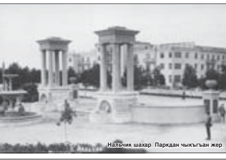
Нальчик шахар. Паркдан чыкган жер.