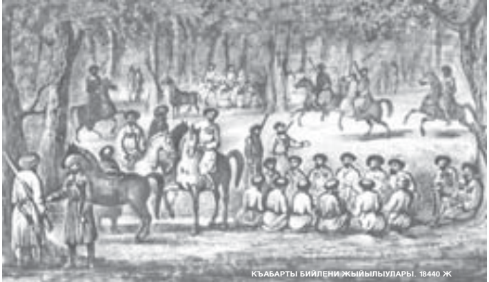
КЪАБАРТЫ БИЛЕНИ ЖЫЙЫЛЫЛАРЫ. 1844 Ж.