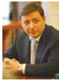
битву Россейде дагыда талай инновациялы проектле кьураргъанбыз. Бююн энди ишлеп башлагъан Федеральнй университет а Се-

Бизни бла бирге кьыралабыз да айлайды. Аны батыл 21 жыл толады. Озган онжыллыкъда биз экономикада, политикада, къоркъуусуздукъ жаны бла кёл жангы затка юйренгенбиз. Билимге тиийли багъа биче, властыны, жамауаты жындан да анга эни эс бурлады. Алай имену, билим берууну, илму-синдируу-производство бёлюмюне бирикдирген система кьураргъа кереклигине тоюшон, «Сколво» илму ара,