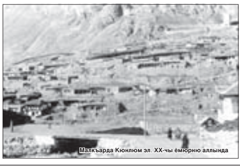
Малкярда Кююном эл. XX-чы эмюрно алында