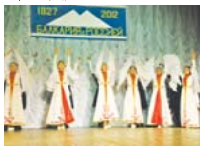
мауат анга ырызлыкны къызыу къарсла бла билдиргенди.