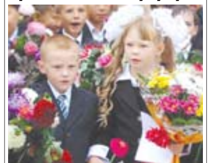
Билими кюннде аталган материалланы 5-чи бетде окуугъуз.