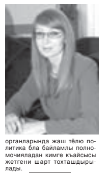
Ахыры 2-чи бетдеди.