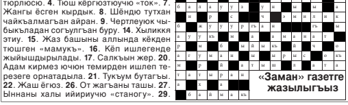
«Заман» газетте жазылыгызы

Газетин 191-192-чи номеринде басмаланган сьзберни жууаплары.