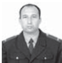
улталгынына кертичилиги аны белгилейди, адамлык даражасына саклыгыны чертеди. Аны халап жоректиги, отургулуну ишине нёгери кесине тер жууклашдырганды. Ол сылык борну намысты толтурурга бек борчланына кеси ийанып кылмай, аны алайгычы башчалага да аныла та билгенди.