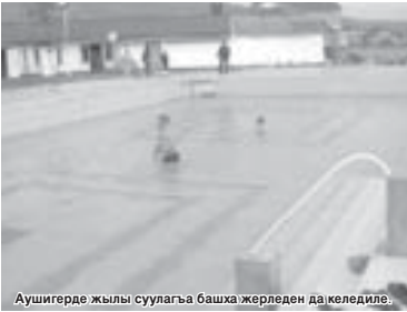
Аушгерде жылы суулаға баша жерледен да келеди.