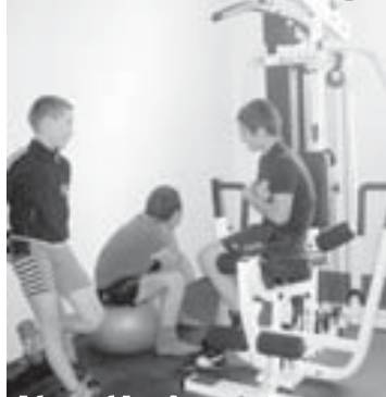
Баугентчи сабийле, шеңдого, тренжерла келтирилгенди.

сакьаллдан бири Хожаналаны Хаким жангы предпритилага адамлаға жалаңда кюлайлык, тынчылык келтирилкери не минанганын айтаңды. «Мен гражданд авиацияны лэгичи болуп турғаным, биз, тамга тейлю республиканы миллион алгыш юсоне салыр ючюн, кыты кершенбиз. Бюгюн а жаш адам»