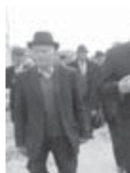
Кыонакылыга Сотталаны Куурманкеси тоюбегенди.

Быллай фермаланы туу элдеде куургарга уа болушкуну, деп сорганма Хасандан. Он аныгыланганы, тау жердеде мал ашыны керекти тенгил хазырларын жокчуду, аны сатып алырга тоюше, файданы уллу болушкуну тоюлду. «Таулада жалаанда бинен атталгыксыз, аны бөл уа ичинке кеңиндириллык тоюлосу. Алгын Терк, Проладна районода жерлерин бөл эдиле, сют фермаларыбыз да анда эдиле. Алай шендо жеррибиз жокчуду», - дегенди ол.