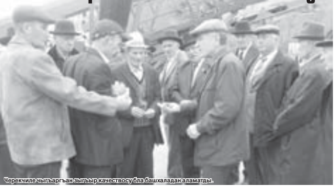
Черечиле чыгъаргъан зыгырлу къачествоуула башхаладан аламатды.

Кертиси бла да, бу ауудда былай бир жангычылык барды деп журналистле да билмей эдиле. Ишчи къыстау баргъаны а районгъа жете келгенде кесибиз да къргенбиз - Герпегежи бла Хасанины арасында жол тапаландырыла тургъаны баргъаны да сейиркирген эди. Болсада жолючулукубузу халпарын