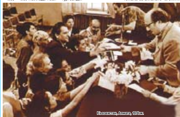
Къазахстан, Алматы, 1974ж.

Поэтни биринчи назму китабы - «Салам, эргентлик!» - 1940 жылда басмалангъанды. Он жыл Къулий улу аскерге кетеди. Улуу Ата журт урушка Прибалтикада тобегенди. Къайсын Назмула жазгъанын къоймагъанды, «Сын отечества» газетте материалла тапдырып тургъанды.