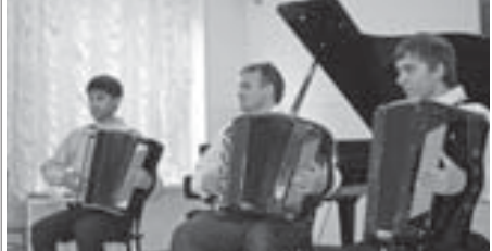
Сабийле кеслери салгын оюндан юзюкюкюрюштедиле.