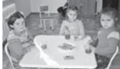
Сабий садны тамата ксугуууна жюрюген кызчыкыла.

халда жазарга, окуруга да ююретеди. Балала не ашарга сойгенленин, баям, Мокаланы Жамиленин ксатышкан журналисттерни тагылуу ашаркыла бла гитичиклени терк-терк кууандырады. Суратланы МАМАЙЛАНЫ Алий алгынды.