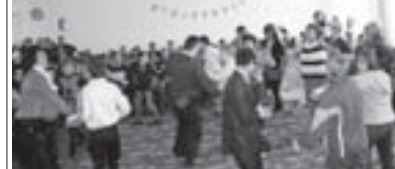
араларында конкурс-кыаруу бардырылганды да, анда бизни бөлүмюно холроп, грант кыолу болганды. Телевизор ма анги алынганды», дегенди.

сегенди, алай баш саусузаланы келлерин кертюргенди. Дистансерди директору Юсуппаны Хасан келгенге улуу ыспас этгенди. «Мында жыл саилары оюондон алгымышка жеттене туралды. Аламы келечиге төрт керк ашаталды. Алагда деп терк-терк торло-торло байрамла кыураул бардыры-