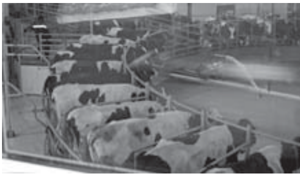
«Агро-Союз» комплексе ийнектелген сауган «карусель» сырь келирин сактапты. Бирден оюондоуанынга да АБШ-дан эм Сауд Аравияда да ишедиле, Россияда а биз биринчилебиз. Кесибиз да кыаллы болса да алай техниканы алырга ашыкмайбыз, багысына кыармайбыз, ол качкылуу болсун аны», деп кыошканды.