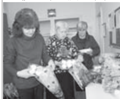
Гия дистансерге саугала этилп барганды.