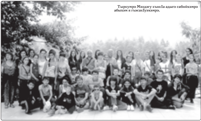
Тыркуурэ Мэдагуу кынкла адыгэ сабийхэмра абыхам гысаклуэхэмра.