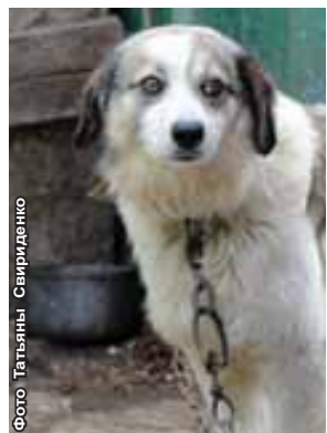
Две собачки, в чьи обязанности входит охрана дома и всего хозяйства, друг с другом в очень хороших, приятельских