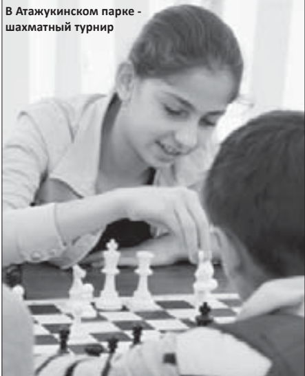
В Атажукинском парке - шахматный турнир