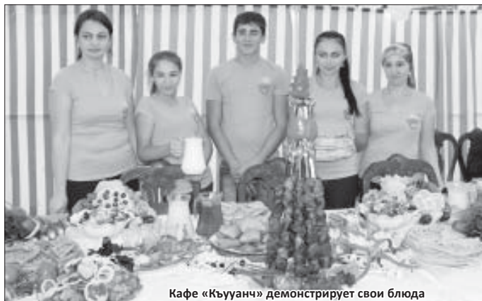
Кафе «Кьюуанч» демонстрирует свои блюда