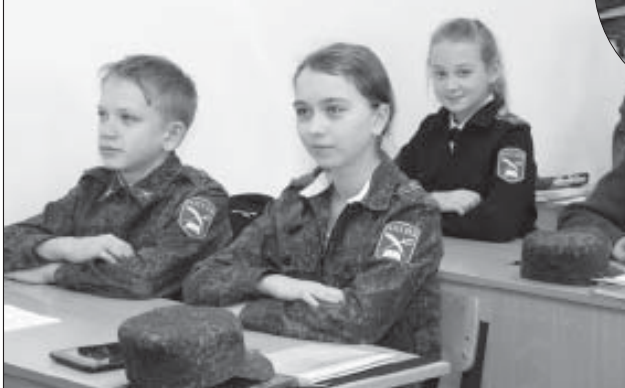
Кадеты на занятиях