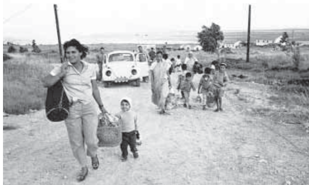
Около тысячи сирийских черкесов приняла Россия. Большинство из них сегодня находятся на территории Республики Адыгея и в Кабардино-Балкарии.

Голаны и переселилась в другие регионы Сирии, преимущественно в столицу Дамаск и крупные города. Около тысячи черкесов – беженцев с Голан – переселились в США. Незначительная часть переехала в соседние арабские страны и в Европу. Новые испытания выпали на долю черкесской диаспоры в Сирии с началом в стране гражданской войны. Будучи в основной своей массе лояльно настроенными к правительству Асада, они вновь вынуждены были оставить насиженные места и перебраться в Дамаск. Многие из них служат в армии и силовых структурах САР, однако есть черкесы, которые сражаются на стороне повстанцев из «Сирийской свободной армии». Из более чем 100 тысяч черкесов и других северокавказцев 20 тысяч уже стали беженцами и в данное время находятся на территории сопредельных Иордании и Турции.