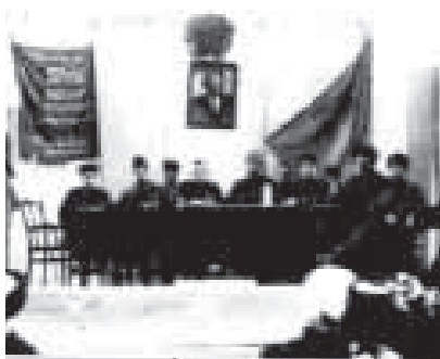
Участники 3-го съезда Советов КБАО

АДРЕС РЕДАКЦИИ: 360000, КБР, г. Нальчик, ул. Горького, 13. Тел.: (8-866-2)76-04-26. Факс: (8-866-2)76-04-26. E-mail: archives_kbr@mail.ru .