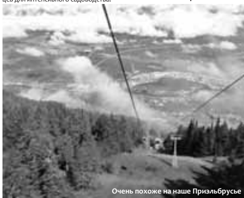
Очень похоже на наше Приэльбрусье

По материалам пресс-службы Главы и Правительства КБР