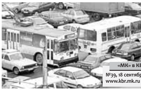
«МК» в КБР»

СЕЙЧАС ПОЧТИ У КАЖДОЙ РОССИЙСКОЙ СЕМЬИ УЖЕ ЕСТЬ АВТОМОБИЛЬ, А У МНОГИХ – ДАЖЕ ДВА