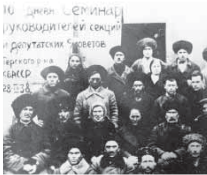
На 10-дневном семинаре руководителей секций и депутатских советов КБАССР. 1938 год.