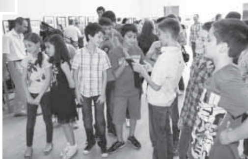
На выставке было представлено более 50 детских работ, выполненных в разной технике, а также пять анимационных фильмов, сделанных детьми на основе черкесских сказок. Работу с детьми ведёт группа молодых людей-волонтеров из организации «Дыгъ». Мастер-классы по рисованию с детьми репатриантов проводятся с февраля нынешнего года. Занятия посещают 40 детей в возрасте от 5 до 15 лет.

ются гражданами КБР. Для тех, кто воспитывает троих и более детей, предусмотрены дополнительные выплаты и льготы. Граждан пожилого возраста примут на отдых и лечение в социально-реабилитационные центры республики, а детей от 7 до 14 лет – в детский реабилитационный центр «Радуга». В настоящее время в школах республики учатся 108 детей репатриантов из Сирии. Из них 101 – в школах Нальчика, двое в селе Кременчуг-Константиновском Баксанского района, пятеро – в селе Благовещенском Прохладненского района. Министерством образования и науки КБР совместно с КБТУ разработана методика обучения соотечественников русскому и кабардинскому языкам. Абитурientов из числа репатриантов будут сдавать ЕГЭ по русскому языку по специальной программе для школ с русским языком как родным. В работе семинара приняли участие сотрудники министерства образования и науки и труда и социального развития. В июле в Национальном музее Кабардино-Балкарии была организована выставка рисунков детей репатриантов, проживающих в санаториях Нальчика.