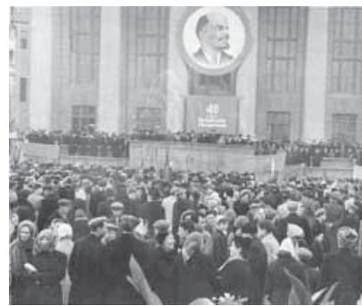
Митинг на площади у Дома Советов в честь 40-летия советской власти в КБАССР. 1958 г.