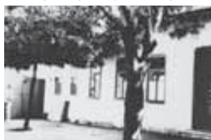
Дом на ул. Кабардинской в Нальчике, где проходил I съезд Советов рабочих, крестьянских и солдатских депутатов в 1917 г.

Органам власти всех уровней и общественности необходимо объединиться, чтобы согласованно и сообща решать самые сложные задачи и идти вперёд по пути поступательного развития.