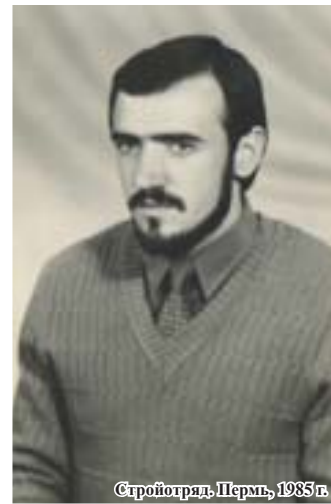
Стройтед, Пермь, 1985г