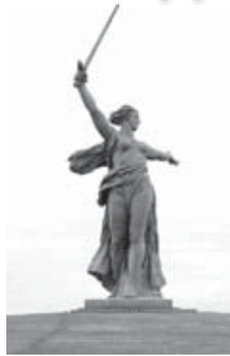
ПАМЯТИ СТАЛИНГРАДСКОЙ БИТВЫ

На миг хочу, чтоб время стало, Чтоб каждый помнил, что живет, И пусть ему не будет мало, Пусть чувствует – ему везет! Уж семь десятков лет назад Шел переломный сорок третий, В слезах и боли вся страна, Борьбою и ознем объята. И был тот бой, где твердь стояла, Непокоренная, взалел Металлом огненным дышала, Ее солдаты шли вперед. Свою твердыню защищали, На вздохе не считая ран, И молча кулаки сжимали, Когда и тело пополам. Там каждый жизнь свою дарил За дом и мир, в котором жил, Нам – кто останется под небом. ...Чтоб помнят героев прах Я так хочу, чтоб время стало, Минутой скорби поддержало И баль в пылающих сердцах.