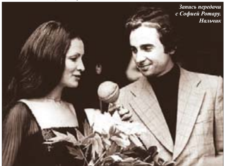
Запись передачи с Софией Ротару. Нальчик