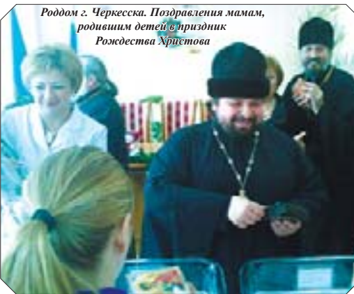
Роддом г. Черкесска. Поздравления мамам, родившим детей в приходе Рождества Христова