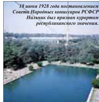
18 июня 1928 года постановлением Совета Народных комиссаров РСФСР Нальчик был признан курортом республиканского значения.