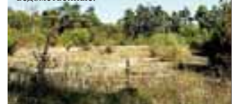
На обоих снимках – курортный бассейн. Верхний снят в середине 80-х, нижний – в 2012 году.

В 90-х годах курорт пришел в полнейший упадок и запустение. Сначала была разрушена система профсоюзного отдыха, сделавшая отдых в здравницах недоступной роскошью для большинства россиян. Затем в санаториях и домах отдыха были размещены беженцы и переселенцы из Чеченской Республики. Их более чем трехлетнее пребывание многие и сейчас вспоминают с сожалением: местные жители предпочитали без крайней необходимости не появляться в курортной зоне. С тех пор, к счастью, многое изменилось к лучшему, но слава Нальчика как прекрасного места массового отдыха сошла на нет и вряд ли скоро возродится. Некоторые санатории или отдельные корпуса не действуют и поныне, а большинство действующих и находящихся в приличном состоянии – ведомственные.