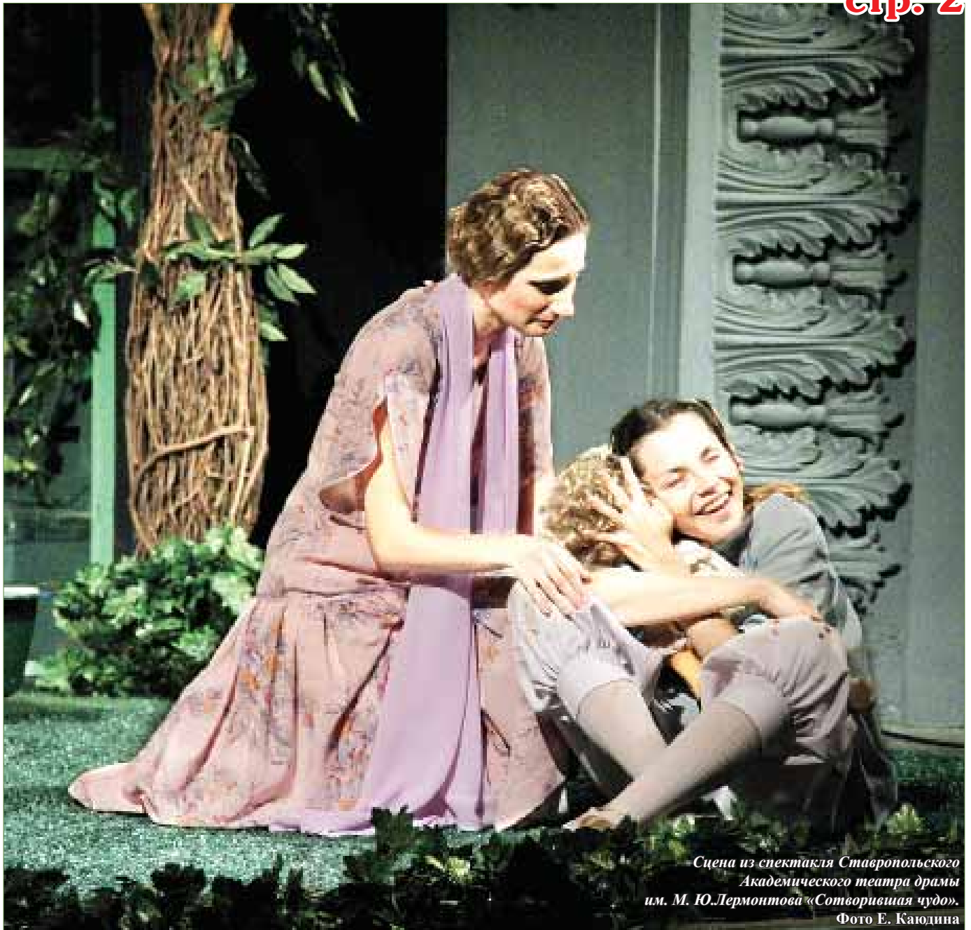
Сцена из спектакля Ставропольского Академического театра драмы и м. Ю.Лермонтова «Сотворившая чудо».