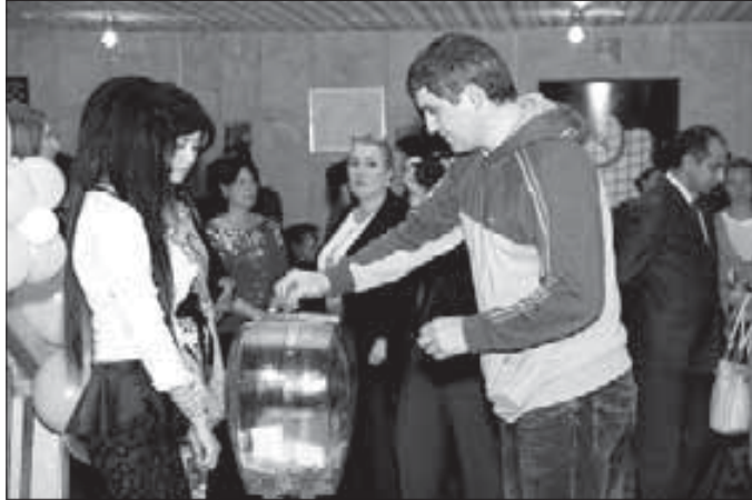
Благотворительная акция «От сердца к сердцу» была инициирована ВГТРК, Кабардино-Балкарским эндокринологическим центром, Детским фондом республики при содействии Федерации профсоюзов. За ходом марафона можно было наблюдать

Начиная с 1991 года ежегодно 14 ноября под эгидой ООН и Всемирной организации здравоохранения отмечается Всемирный день борьбы с сахарным диабетом. Мероприятия, приуроченные к этой дате, прошли и в нашей республике. Так, в ДК профсоюзов был организован благотворительный телемарафон по сбору средств для детей, страдающих этой болезнью.