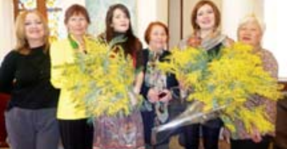
Кермючкө кытышканылы кызуу.

Хар заманда, 8-чи марты алынды КъМР-ни культура фондуна республикабызны суратты тишируларыны «Жазны теңири кылыч» деген ат бла кермючлери ачылынды. Анда онсеги эстори, хар тюрлю төлөлени ишлери керпюр онг барды. Аланы хар бири да теңири кылычны тюрсюнлери бла жашау, ариулулга жар айтдыла.