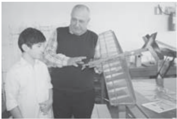
биринчи атамларын этедиле. Абаданыракла республикалы, россеяли эршишулеге къошуладыла, гитчеле уа алабга барып кырадыла. Бу кюнде Нарт къалада авиамодель спортдан россеяли чемпионаты болуукду.

Кышкатауда авиамодельный кружок ачылып алдыра аркасыз жорюп башыла. Юретиуносо айткан хар ууак затны да эсине ала, самолётланы, ракеталаны модельлерин ишлерте иттингенди. Арда шолону бошоп көргө кеткенди да, авиацияга тешкенди, механики борчларын толтурганды. Кылулгуына жууалпы кёздөн кырагананы ючюн командованиндан мактауга көп көрө тийишли болганды.