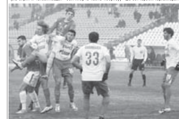
окуна чабыуулукта этил тегерилде. Трибуналага жыйындыла уа, суук болганына да кырамай, шинтиккеге да олтурмаганды «Спартак» алагы деп, сойген командаларын ики кесе заманын келлендиргендей тургандыла.

Аны бля футболчуларыбыз чемпионатда онуну эм шендо бек керекли хорламларын