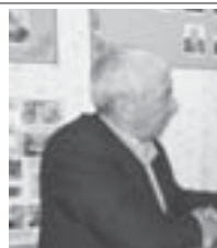
Хорламы мағанасыны, урушун ачыгызыны кеслеринден халар айткандыла.

Байрам ишлени уа совет апрель айда окуна башлаганды. «Эстафета подвига» деген акцияны чеклеринде ветеранла школлада, орта профессионал билим берген койдеде жаш адамла бла тобушип, алагъа