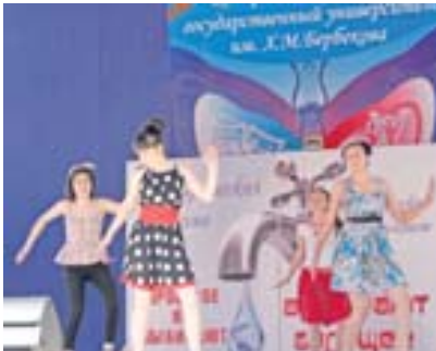
Студенте фахмуларын кѣргозгендиле.

Быйыл Къабарты-Малкъар къырал университетде башланган «Студент жаз башы-2013» фестиваль республикабыз эмда Север Кавказ немисли ууучлау-чуладан азатланганлы 70-жыллыгына жораланганды. Кеси да «Спасибо деду за Победу» деген ат бла бардырылады.