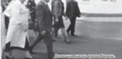
Делегация дивали аралаш барарды.

Сора болгонди иги ишлегени кереклигин чертегинди. «Битеу операцияланы 80 процентин сиз кесигизде аталгысыз, саусула нынчы Нальчык жибермей. Ол иги жетишимди» - дегенди ал. Сора болгонди иги ишлегени кереклигин чертегинди. «Битеу операцияланы 80 процентин сиз кесигизде аталгысыз, саусула нынчы Нальчык жибермей. Ол иги жетишимди» - дегенди ал.