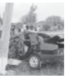
Аварияда ачганын жашчыккыны олсагыт окуяна Прохладный район болычысына жетдиргенди, аллай ол, кесине да келмей, кыска замандан сора өлгөндү.

Ол кюн тошде ючю жарымна 41-жыллык нальчикчи ВАЗ-21099 машинада Прохладныйден Боксан таба бара болганды. Ол кезинде уа, жезу жорючулолөк жолдан өтөргө эркилчеп берген белгиге 200 метр жетпей, альпыйлык жашчык жолдан өтө болганды.