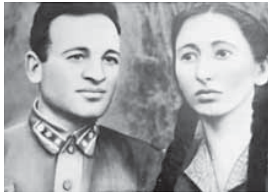
Юй бийчеси Азий бла.

Жашуа Созай улу кеп тюрлю жумушлагъа тыобтенди. Аны, район аскер комиссари-