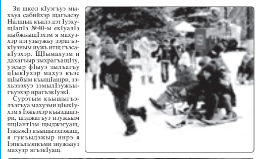
Сурэтхэр КЪАРЕЙ Эллиэ трихаш