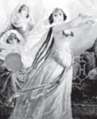
Тамара и кьыфэ. Зичи Михайл «Демон» псом кьыпшын сурат. 1851 гъэ