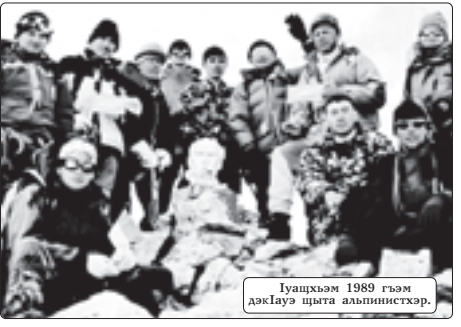
Иуахшэр 1989 гэм дактууа цыта аалинистэр.