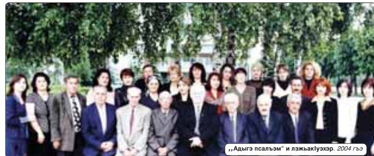
«Адыгэ псалгэ» и лэжактуэ хэр. 2004 гъ

«Адыгэ псалгэ» газетыр лэакткым къыдогъуэурыктуэ абы и гурьгъу-гурыццэ хэр шьтауэ, зыужыныгъм кыгуырджыу. Сын элани цыху кьуагъуэ, а гуыкыгуэ-гъуи я ехгъу.Лэныгъи цхъгъэлэу абы илгъэ 90 гьугуанэр къыэзрынцлакъ. «Адыгэ псалгэ» * кьыццэ ялац тхактуэ, усактуэ кудым. Анхуэмьдуи, дауи, хъуи?! Бэар зыгъэгурыццэри, абы зыгуыдзщцэри ахэриц. Дызэргъушхуэц ди газетым шьлэжэ журналисткэм КъБР-м и цыхуэб тхактуэ хэр, усактуэ хэр, Совет Союзэм, республикам я Къарал сауэзтхэм я лауреат хэр къызэрхэгъадам. Нобарь къыдокыгуэцм ди гъуагъу тыдоджэ «Адыгэ псалгэ» газетым цыгъэжэ усактуэ зыбжанэм я Иэдакъэццэ Игъм цыцхэр. ИСТЭПАН Залинэ.