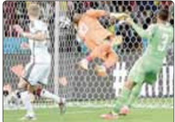
О дунчынго чыкчынго

Кэнжэ кьуажэм Шэнхавзаикэ и унам иджьблагэ шагьэлэ- лаш библиотекэм лэжжэ зэрэ- шцывазэр илхэс 90 зорьхьур. «Тхьылгырэ ди лэпэгьгуэ» зыфа- ца пьхьым кьрибьлэш кьуа- жьдэсэр, ньбжьышцхэр, тхьлэ еджэ зыфэцхэр, ар унафашц кьуажэм Шэнхавзаикэ и унам иджьблагэ шагьэлэ- лаш библиотекэм лэжжэ зэрэ- шцывазэр илхэс 90 зорьхьур.