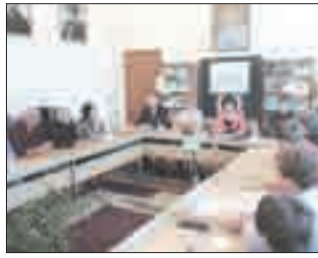
«Согласие сегодня - мир навсегда»