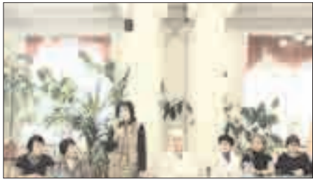
Конкурс чтецов и исполнителей в МК