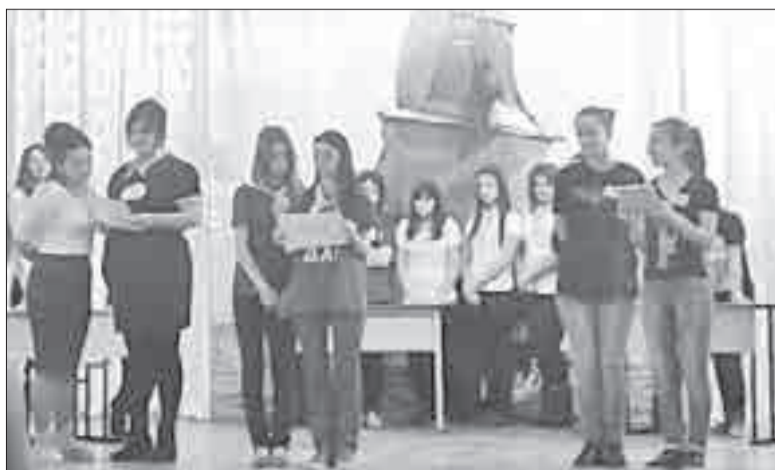
фото знаменитостей», они заработали дополнительные баллы любимым командам.

шая лига» (4 К гр.). На конкурс были представлены следующие задания: разминка «Жизненный и профессиональный кодекс педагога»; конкурс капитанов; домашнее задание «Мы – артисты»; конкурсы «Если бы...», «Гвоздь программы», «Пойми меня», «Скалолазы», «Памятник». Каждая группа показала умение работать коллективно, творчески, проявляя профессиональное остроумие. Увлекательно, нестандартно выполнили конкурсанты домашнее задание, где были инсценированы детские сказки в жанре комедии, трагедии, драмы. Особый интерес у зрителей вызвала сказка «Теремок», подготовленная командой «Высшая лига» в стиле трагикомедии. Герои сказки озвучили актуальные проблемы Евросоюза и России. Запись выступления можно было направить президенту США Обаме, и это был бы действенный политический шаг. В конкурс были вовлечены и болельщики. Выиграв в заданиях «Что бы это значило?», «Детские