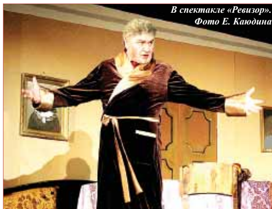
В спектакле «Ревизор».

обертки – мне может когда-нибудь пригодиться в спектакле. У меня есть своя жизнь, параллельная внешней. В голове возникают какие-то вопросы-требования и восклицательные знаки, мне надо этот момент поймать, что-то записать, потом остаться одному, чтобы это осмыслить».