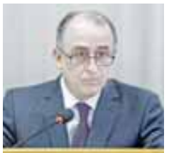
Ахыры 2-чи беттеди.