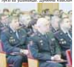
Ахыры 2-чи беттеди.

Хар сомну –жаланда керекли жумушлагыа 2014 жыл не жаны бл да тынч болуксга ышайды. Дунияны кьсыхан