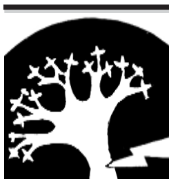
Малкър халкъ туугъан жеринден зор бла кечюрюлгени- не 70-жыл

Женгерле уа, казан, чонон- лары биргелерине болганы себепли, кесген малын тап биширип, аланы тойдуруп, кыал- гын этни да жол машокларына саладыла. Алайда аскерчилени таматарлы Догуча улугы: «Не- мецциле ызыбыздан кысыха жетип келгенлери ючюн, ахула-