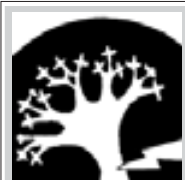
Малкыар халкы жуугун жеринден зор бла кечорюлгенине - 70 жыл