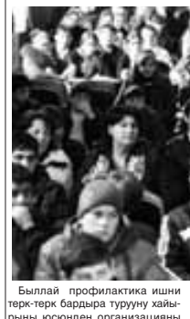
Былай профилактика ишини терк-терк бардыра турууу хайрыны юсюнден организацианы

«Юйюне мамырыкъ» деген регион аралы жанауат организациада кел болмай Анрозей элде «Жаш төлю экстремизм эм андан кытуулуу амаллары» деген темага жоралыны тобашыу болгъанды. Алай бла Лескон районну толтуруу власть органларыны эм билим берги укреждендилерини келечеклерини кытышылары бла жаш адамлары граждан позициялары кючлер мурат бла ачыкъ дерс этгенди.