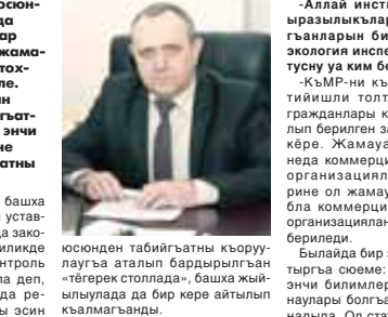
июсюнден табийгъатны кьоруулаугъа аталып бардырылганды «негерек столууда», башка жыйылууларда бир кере айтылып къалмагъанды. Республикабызны халкыны эсини Къудуретни сакълануу проблемаларына бур, алыны кетериуге аны да кыткъашдырыр мурат бла алай документ хазырлагъанбыз. Ол бек кере болуп тургъанын

«Мен билгенликден, «Экологияга жамуат контрольну июсюнден» республикалы Закон «Къудуретни сакълануу июсюнден» 2001 жылда окуна къабыл кёрюлген. Федеральны законна тийишликте жарашдырылганды. Шендо алай жамуат институту региона некер болуп къалды? - Керти окуяну, ол Федеральны законну 68-чи статьясында жамуат бригиуле эм