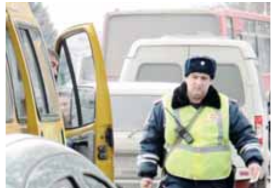
327-чи статьясына тийшлиликде кимле жууапха тартыллыктары белгили болганды. Рейдни кезиунде ачыкъ-

Битеу ол тюрю терсликлетипти, аладан къаллайлагъа РФ-ни Уголовный кодексини