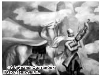
«Абайланы Солтанбек» Юзюлген Кыйл.