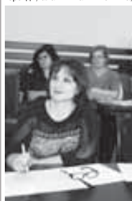
Конференциягъа къатышкъланы къаууму.

Айылмайды. Аны себепли жаш адамла бла тобеишле къурааргъа керекди. Мен атасы анасы айта: Бийик окуюу юйге кирип, аны бошгъаннан сора уа иш тампай, башха усталыкъларгъа юйенип башлагъан кеплени таныйла. Алай болмаз ючюн, таматала бла да тобеишери, аланы араларында да аныгъатлы иш бардырыгъа тийишлиди. Бу жумушка асламы информация органа да улуу себеплик этерге болжукъларда, -дегенди Хоу улму.