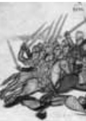
Айгырманы да тутуды. Сёз ючюн, Кыра тенгиз - Демонгли тенгизи.

бла гуннланы туудуклары болганларыны чертеди. Атилла ёлгенден сора ала башка миллеттерин араларында башчылык алгыга корошедила. Алай бла 632 жылда шёндого Россия, Украина, дагыда Кыра тенгиз, Азов тенгиз, Кыбан суу жагыларында, Таман жарым айракында демонгли Кыра Болгар жаратылды.