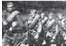
Къан кыатыш болуп, бойда кыалгырды Бууунумда алтын сагызтам.

Ой, эрттинимде, сагызга тугузда, Мен машинага мингенме. Анам, эгечим, сау кыалгырды, Мен кызауатка киргенме. Машина бла кетип барам, Сиз сау кыалгырыз-саламат. Ораманда кыалгыр хангыз эгечим, Ой, анам, санга аманат. Бычаклыла бла кырып алалла, Мени полгаз акыган кыаньмы. Бир сангыты кесип алабыз деп, Бир бек кырайла жанымы. Ой, кыайда хужу кыалган болупта Мени ючючю малларым. Германияда курот этип кыалдыла Мени субай сангарым. Былай болганымда, кишен кыачанды Мени тобюнде тор атым.