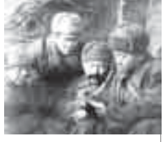
Танкдан чыкгыган багырбаш жилин Ешюнон манга кыайдырды. Пулеметдан сызгырган окьла Жанын дуниядан айырды.

Алгына аriu жарашады Энверни оки чаргыны. Армиягь кетип, келмей кыалганды Эки кѐзюмю жаргызы.