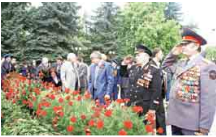
Ветеранла Емюрлюк отну къатында.