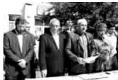
Ананы орунбасары Рахалияны Мурат да алгыншыл сузюну айтадан сора конкурсуа кыатышкандыла, аудиториялага барып, ишлерин башлагандыла. Эршиуи эки сагынны ичинде барганды. Ахырында жорини кызуу бек игилени атларын тура эттенди.

Озган ыйкы кон Нальчикде Север-Кавказ ислам институту Кууранны бек ич окутуу аны араларында конкурс бардырылганды. Ары дери уа аны кыатышкандар районлада эршиген эдиле.