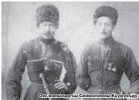
Онг, жанындагы Суйюнчланы Кыумукду.

кыатында бардырылган сермешде этген жигитлиги ючюн алганды. Ол тасхачы негерлери бла жау аскер бөлүмге тубеп, ала бла кыаты сермеш бардырып, тийишли болган эди.