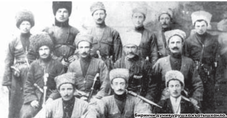
Биринчи/дуния урушка кыатышканды