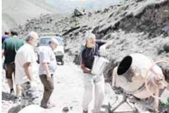
Иш къыстау баргъан кезиу.

эти юйюню юсюнден да халап айтабыз. Куйиланы Къайсын туугъан юйю ичине, тышанды да къар айланганыбызда, бийкъ кыяны артындан эки уллу куш чыгып, тегерек айланып башладыла. Аланы ызырындан дагыда ючюсю чыкъдыла. Ала ити кесек заманы учуп, арты къайтыла. Биз да ишибизни къолга аладыкъ. Жыйрымметрлик уруну тогуз-он адам къыска заманы ичине керелиси тенгли бир ташла бла толтурдыла. Хар затны да къол къыстау бла этерге