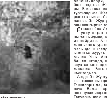
Къамгүрт бийни кешенеси.

Бу журту баш жанында суу секрмите барды. Анга уа Жамалутинни чумхору дейдиле. Бурун заманда Геккиланы Жамалутин илигин ишлеп, андан суу тартып, ол тийреде бахсыны, биченигин да сугарганды.