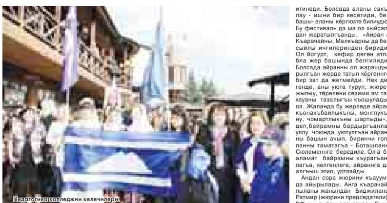
Педагогика колледжини келечилери.

къазауатадыла. Ала келген къонакълагъа тишшиликча тюберге кюрошдиле. Алай этерге кыларыннан да келеди. Бу иш Россияни Туризм жаны бла федеральный агентствону себеллик этюу бла бардырылганын да белгилемей жарамас.