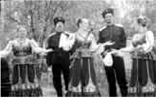
«Терские казаки» ансамбли.

халкыланы биригуилерине себеплик эттениң белгилеп, бусагытада Украинда бола тур-ган тыңгызлыкыга жарсыганларын айткыдадыла. Мухамед Мусабиевич а култура арала Мухалл Лермонтовну «Выхожу один я на до-рогу» атлы китабын саугалаганды. «Жый-ымдыкда назмуланы атымышдан артык автор кырк беш тилге көчүргөндү. Орус поэти ёлмосоз тизгилери башча - башча тилдеге кылай ариу, эңчи эшитилинеди. Бу ише эки малкыры, эки кырачайлы, эки кырабайлы да юлюш кышханлары бизни өтөлөндирип, мындан ары да ахшы учмуулагы келлендиргенди», - дегенди ол. Фестивальны чегинде кел жарык, кон-церт номер да көргөзүлгөндү. Жыйыл-ганыланы чыгармачылыклары бла «Тер-ские казаки» жыр эм тейсеу кыууым, Музыка