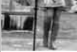
Сахнада Жангоразланы Камилла.

Биогонлюкде быллай жыйылуланы магна-аналыкылары улуу болганы сөзсөзюдү. Эмюрлерден өври да республикабызда тиор-люстурно миллеттеги, динини келечилери мамырлыкыда, шукөлүкүда жашаидыла. Бир бирлерине адет-төрөлериң, кез кыраамлары журметлеууу бла ала, кеслерини адамлык шарттарын бийигирек эте, тин байлыкларың айткытадыла.