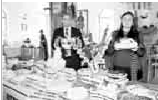
Черек районну келечилери.