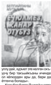
уллу дери, журмет эте келген юкюнде ол кёпкөрдөн ары да, бери да этенча боларды».

бийликлерине дери кётюролоди. Ол чыгармаланы юсуалдан айта, Мугалипни кыоалдан кырадыны Бабаланы Ибрахим китапны ол сөзюнде боюмун жазганды. «Поэт назмуларында Океандын Кязимге дери нечче өмюр озган эсе да, барыны да сыйындырып койган кибики. Жаз тил бля айтканды, кылаубаладан бизни заманга кыел көрүп тархан кибики... Аны терен анылап, уллууга