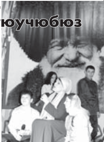
Сохна оюндан юзюк.

Байрым кюн Кызлар концерт залда аты айтылган малкыр поэти - Мечиланы Кязимни - 155-жыллык юбилейине аталган «Сизни бла жашасын мени керти сёзюм» деген уллу байрам куураалганды. Ары келгенге аламант кёрмючте кырагыра да онг тапхандыла. Адабиятыбызны мурдорун салган, миллети ючюн жюргөй бля жырсыган, ачыкк сёзюм жамаутатха эшитдиргенге кыркмаган жарыксыландырчууну, асылымын чыгармачылыгы бизге боюнлюкде да сейрди. Аны журметине жоралган ингирге бек кеп адам жыйылганы да ол себепден болур эди.