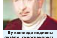
Бу конюде индияны актёру, киноактери, режисёр Рашид Капурга 90 жыл толук эди. Ол кесини заманында кинокусулоны саугаланы барын да алганды. Актеру аты уа битеу дуняда да индиялы Чарли Чаплин» деп белгили эди.

режисёр Индияны жашауу - турмушун, халкыны миллет эңичилигин ачыкк баямлагыланы адамага улуу сыймеклиги бла ишлегенин хайрындап эди. 1988 жылда аңа өз кызыралыны кинокусулоу студию адым бийик Д. Пхалке аты саугасы берилгенди ол соевденди.