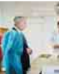
белгисиза электронкоп генератор сатып алганды эдиле берге.

Компания бу учрежденилагыа былтыр да болушук этгенди. Энергетикле жарым миллион сом