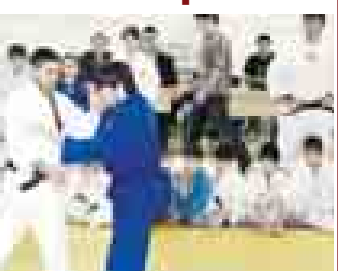
лы апындан сауғыга кимонола берилгендиле.

Геюрге кюн Къабарты-Малквар къырал универститети физкультура эм спорт факультетини залында жаш дзюдочула жыйылган эдиле. Аланы бек гитчелерини жыл саны - жети, тамадарлары уа отуздан атлаганы эди. Ала берге республиканы кёп районларынды, шахарларынды эмде Чечен Республиканын окуучуна бошдан келмегендиле. Россей Федерацияны дзюдодан жыйымдыкъ командаасын членлери эм тренерлери алағыа мастер-класс кёргозторге керек эдиле.